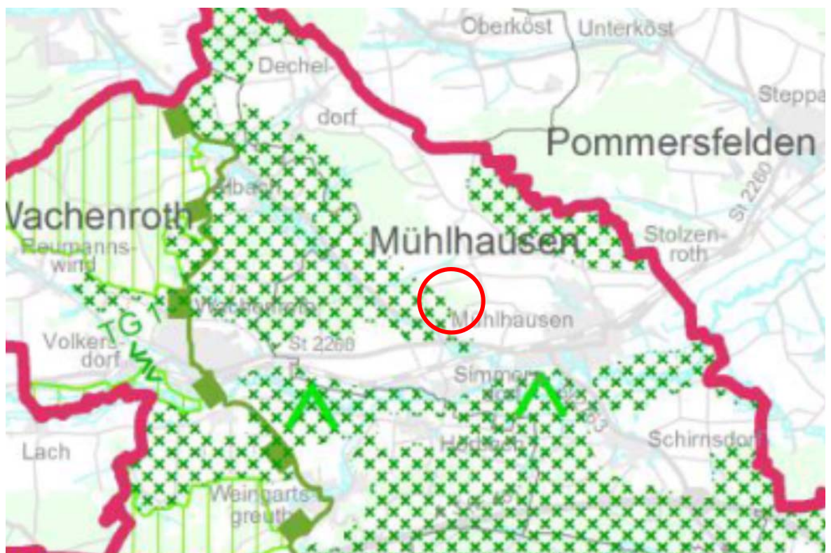
Planausschnitt aus der Karte 3 „Landschaft und Erholung“ des Regionalplanes mit Lage des Plangebietes (roter Kringlel)

Das Plangebiet befindet sich außerhalb eines landschaftlichen Vorbehaltsgebietes (vgl. nachfolgender Planausschnitt aus der Karte 3 „Landschaft und Erholung“).