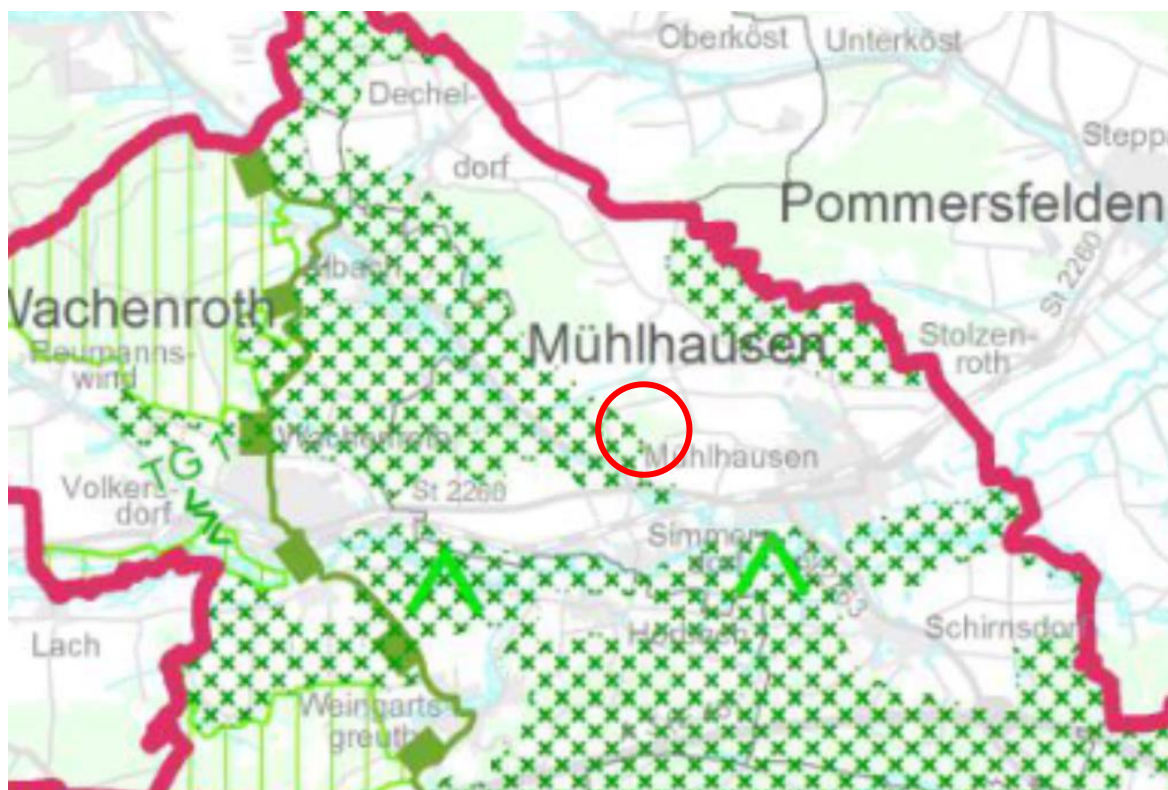
Planausschnitt aus der Karte 3 „Landschaft und Erholung“ des Regionalplanes Region Nürnberg mit Lage des Plangebietes (roter Kringel) Stand 13.08.2018

Das Plangebiet befindet sich außerhalb eines landschaftlichen Vorbehaltsgebietes (vgl. nachfolgender Planausschnitt aus der Karte 3 „Landschaft und Erholung“).