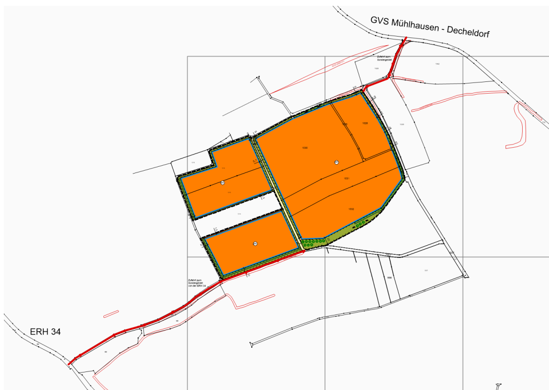
Abb. Zufahrt zur geplanten Photovoltaikfreiflächenanlage – rote Line sind die Zufahrten über landwirtschaftliche Wege (nicht maßstäblich)

Das Brandrisiko ist bei Photovoltaik-Freiflächenanlagen gering, da die überwiegend verbauten Elemente aus Metall bestehen. Der Nachweis einer ausreichenden Löschwasserversorgung in Anlehnung an das DVGW-Arbeitsblatt W 405 ist daher nach dem LANDESFEUERWEHRVERBAND BAYERN e.V. entbehrlich. Zu einem möglichen Feuereinsatz wird ein Feuerwehrplan nach DIN 14095 erstellt.